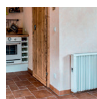
Teplotní zóna 2