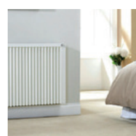
Teplotní zóna 1

Bezdrátový termostat X3D je rozšiřitelný o rozhraní domovní automatizace, které lze připojit k routeru. Tímto je možné pomocí bezplatné aplikace provádět pohodlné bezdrátové ovládání prostřednictvím chytrého mobilního telefonu / tabletu PC.